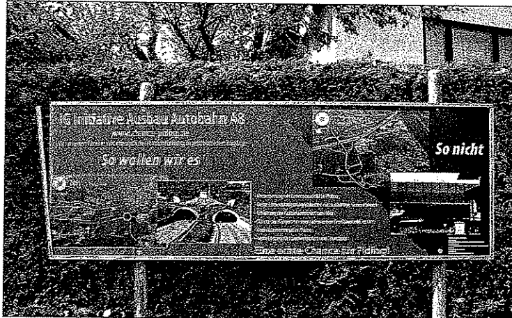
Die Interessensgemeinschaft „Chance für Piding“ beispielsweise ist für eine „naturfreundliche Nordumfahrung in geschlossener Troglage“.

Sechsstreifiger Ausbau in Relation nicht so viel teurer - Lärmschutz entsprechend der Gesetze